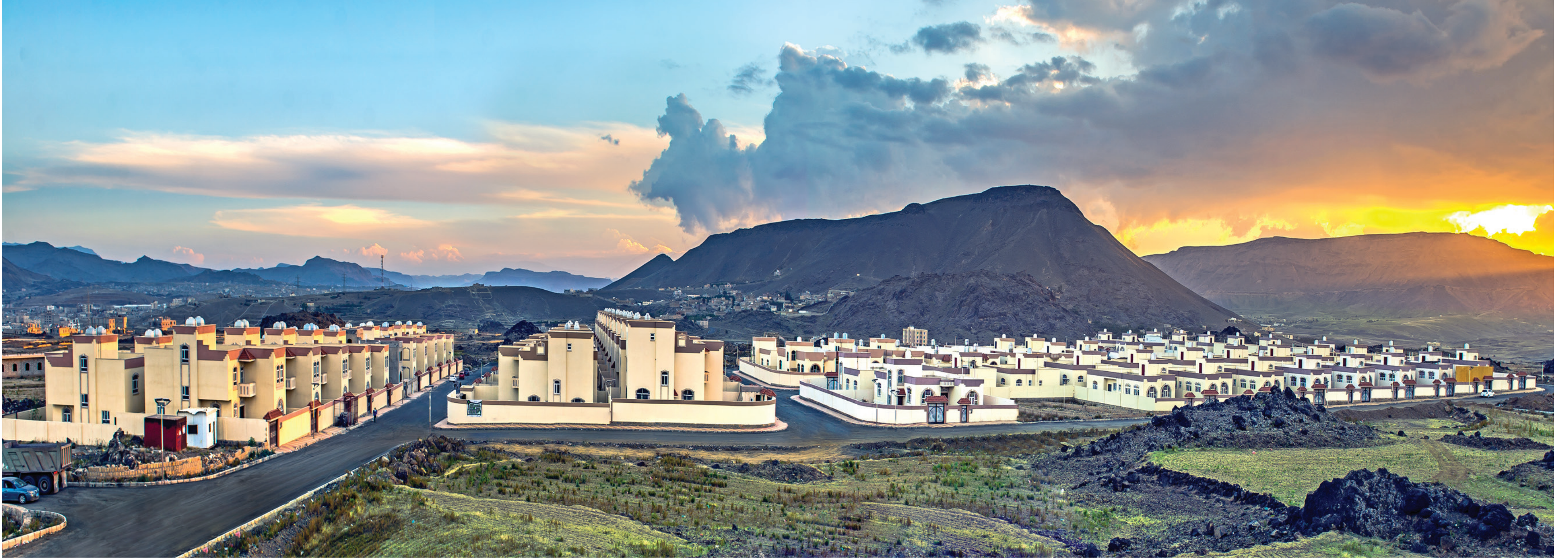
تضامن سيتي - صنعاء المرحلة الأولى TADHMON CITY - SANAA PHASE 1